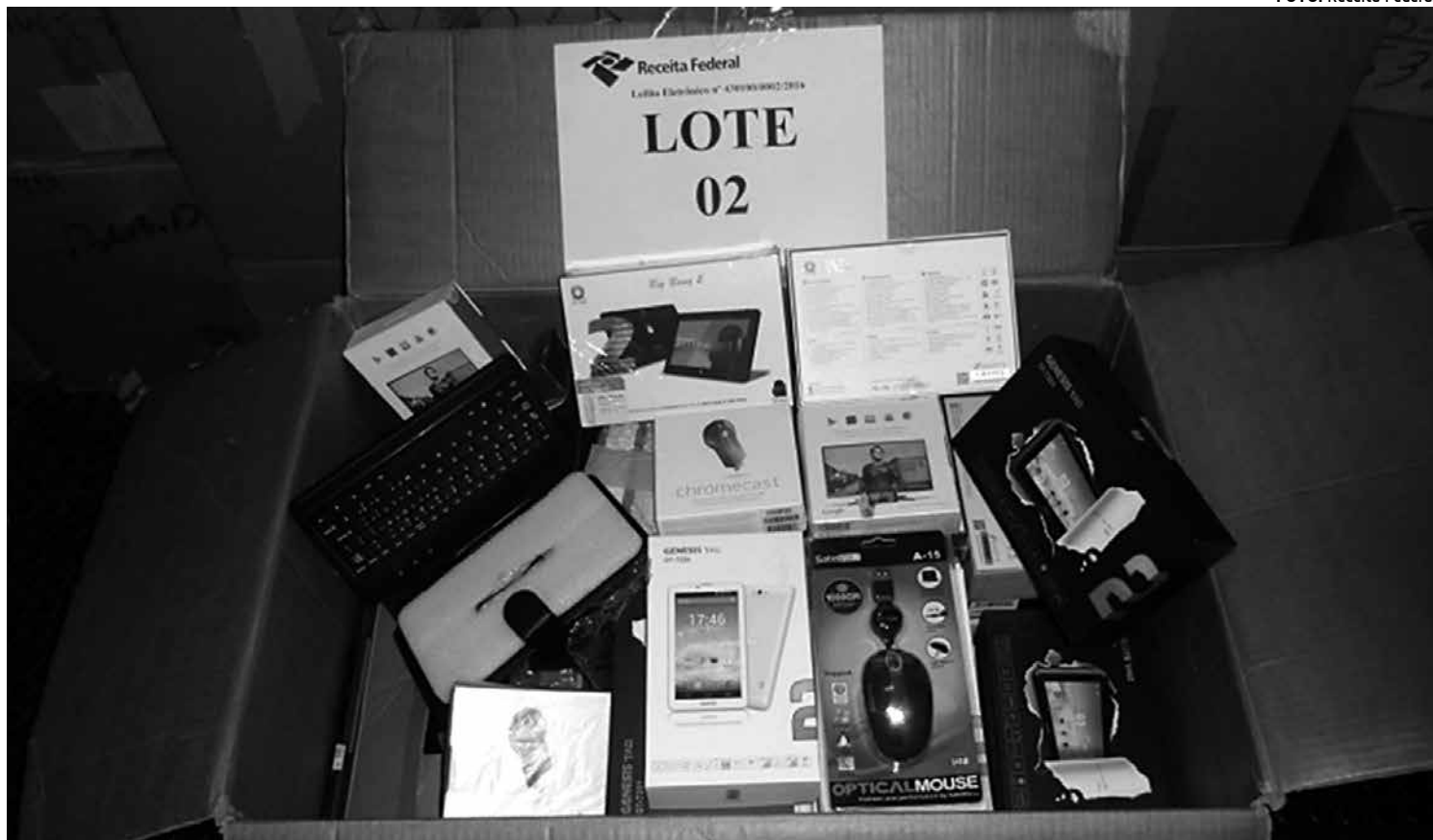
Celulares, notebooks, tablets, material de informática e drones estão entre as mercadorias apreendidas que são levadas a leilão

O delegado também explicou que os produtos que são leiloados não entram no País por contrabando, como a maioria das pessoas pensa, e sim sujeitos a descaminho. Segundo ele, a diferença é que o contrabando ocorre quando um produto proibido entra no País. No caso do descaminho, os produtos são legais e só tornam-se ilegais pela falta de pagamento de impostos.