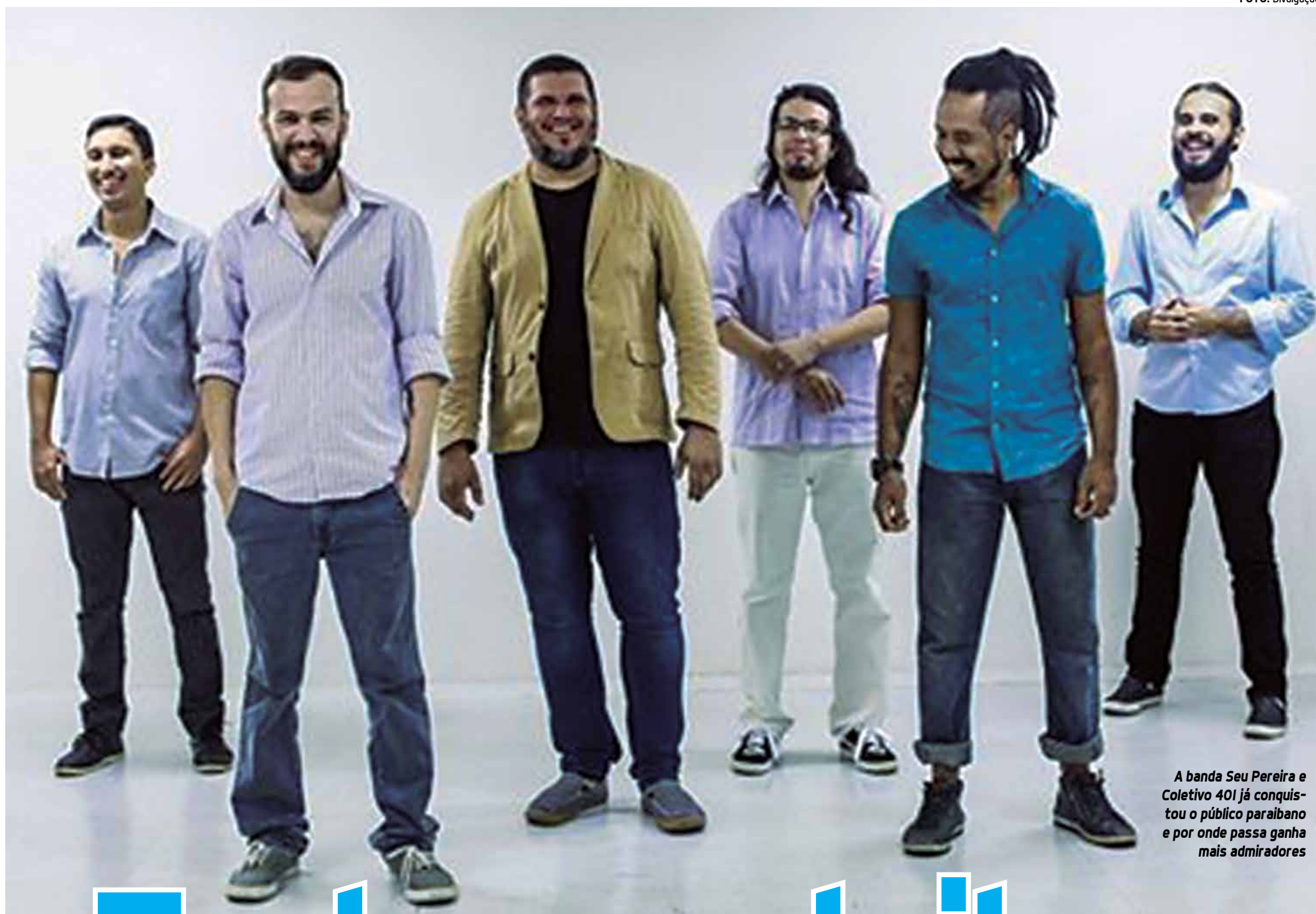
A banda Seu Pereira e Coletivo 401 já conquistou o público paraibano e por onde passa ganha mais admiradores