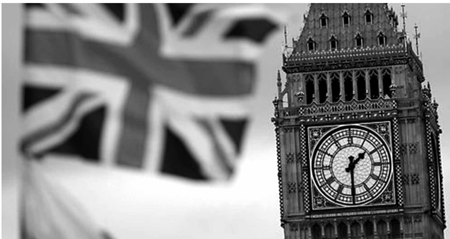
Taxa de participação no referendo que decidiu pela saída da UE foi de 71,8%, a maior em votações realizadas no Reino Unido

O Reino Unido decidiu deixar a União Europeia (após 43 anos de participação) com 52% dos votos a favor no re-