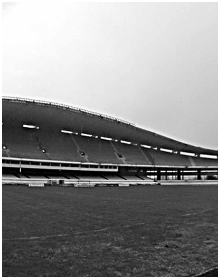
Encontro das equipes será no estádio Mangueirão, no Pará

Jogadores do Cruzeiro estão felizes pela vitória esmagadora diante da Ponte Preta, na rodada do meio de semana, em Campinas-SP