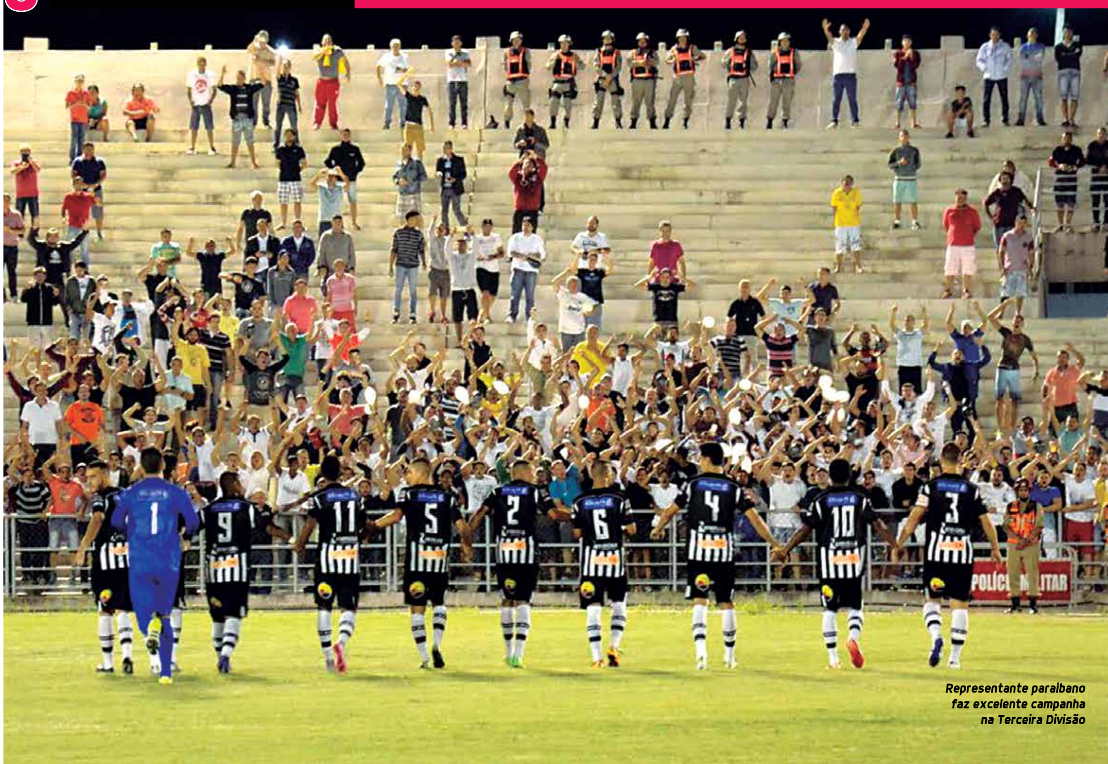
Representante paraibano faz excelente campanha na Terceira Divisão