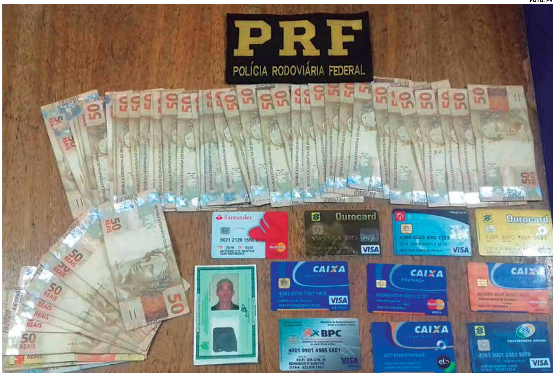
Com o suspeito de estelionato foram encontrados cartões bancários e uma quantia de aproximadamente R$ 2.500; ele já havia sido preso em Alagoas, Bahia e Ceará

Qualquer informação sobre condutas criminosas desta natureza ou similares, além de possíveis localizações de membros de associações criminosas, poderão ser denunciadas de forma anônima pelo Disque Denúncia da Polícia Civil, através do telefone 197.