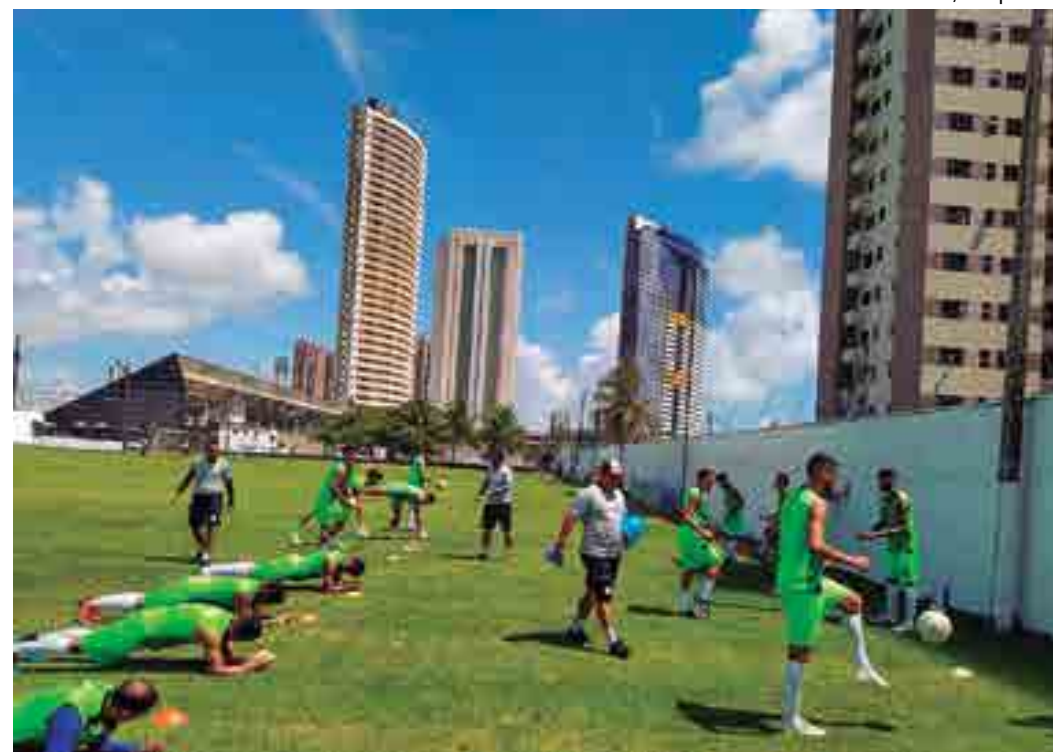
Antes da viagem para Ceará Mirim-RN, os jogadores participaram de atividades, ontem pela manhã, no CT do ABC