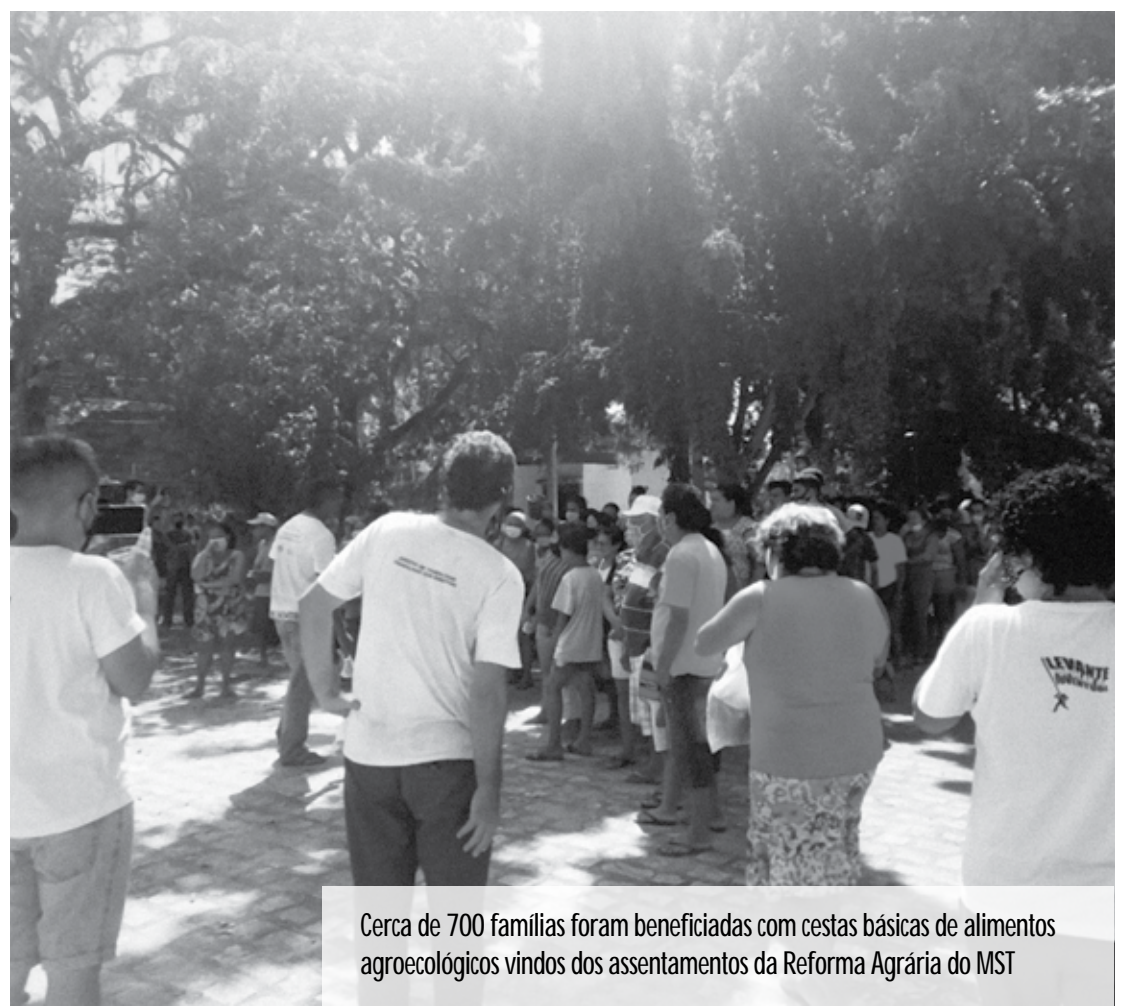
Cerca de 700 famílias foram beneficiadas com cestas básicas de alimentos agroecológicos vindos dos assentamentos da Reforma Agrária do MST