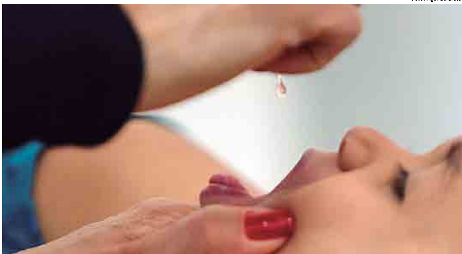
Público-alvo da vacinação contra a poliomielite são as crianças menores de cinco anos; já a multivacinação busca atingir menores de 15 anos de idade