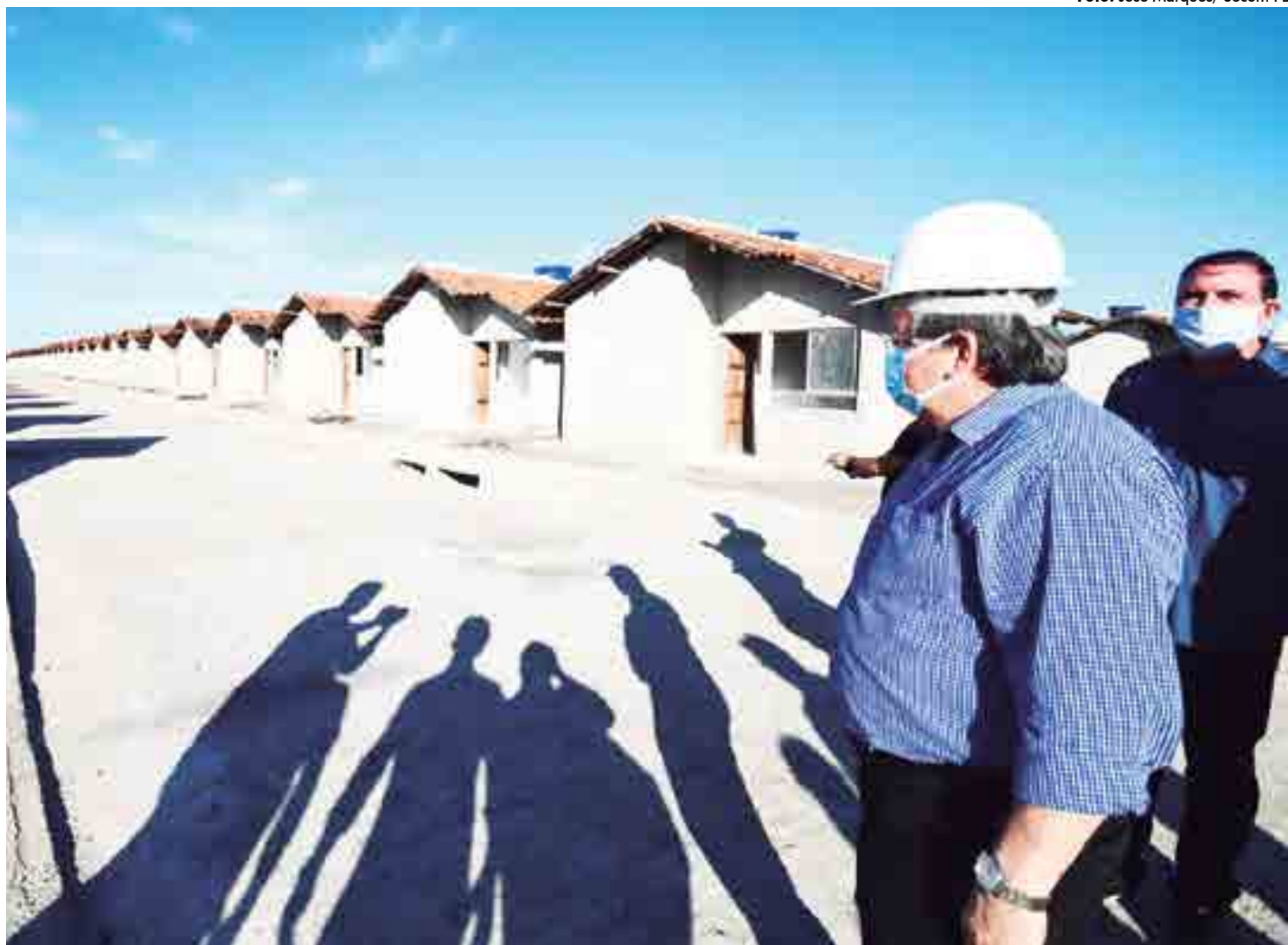
Governador João Azevêdo, acompanhado de auxiliares, visitou as moradias que vão beneficiar cerca de duas mil pessoas com renda até R$ 1,8 mil

As unidades habitacionais são construídas em uma área de 41,27 metros quadrados e obedece às especificações mínimas exigidas pelo Programa Minha Casa