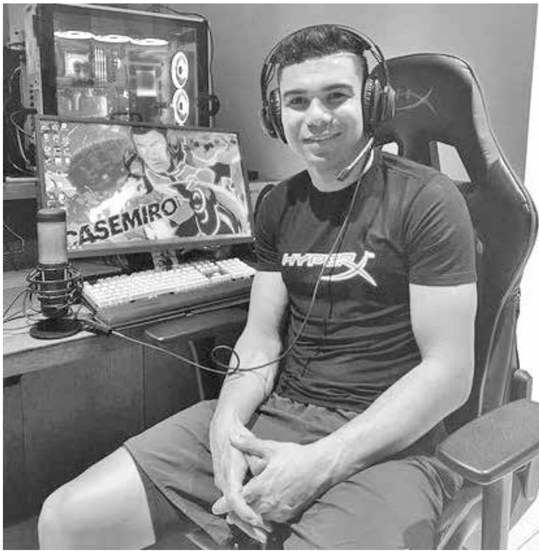
Casemiro, volante do Real Madrid, fundou a Case Esports e se diverte com jogos nos cenários Fifa

Além de Neymar, outro jogador da seleção se faz presente no mundo dos games. Volante do Real Madrid, Casemiro fundou a Case Esports e a equipe participa nos cenários competitivos de