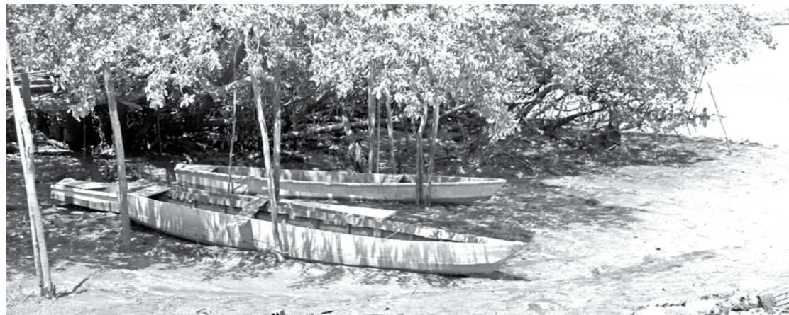
No meio do mangue