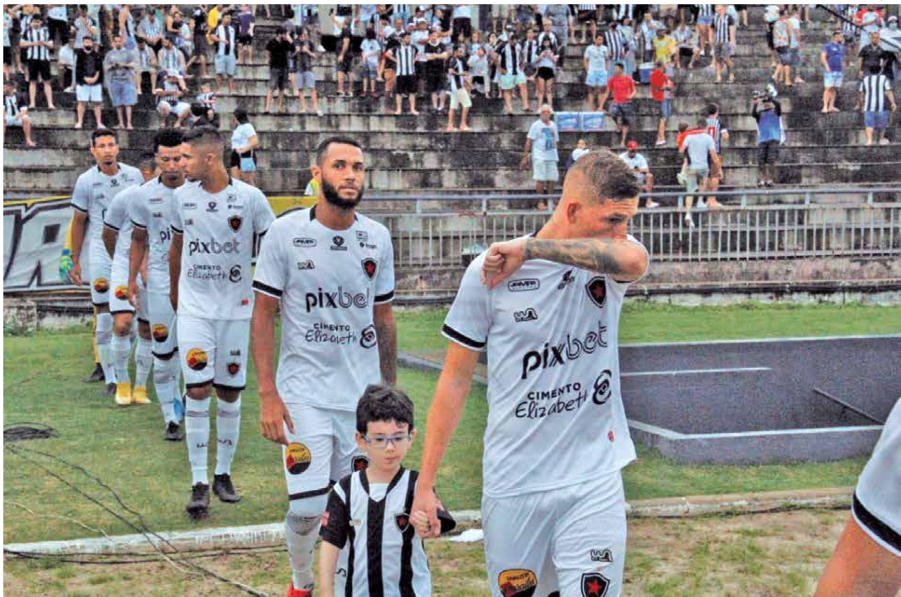
Os jogadores do Botafogo não vão entrar em campo neste domingo no Almeidão por conta do adiamento do jogo contra o Mirassol, que passou para o dia 13 de julho

Mesmo com o adiamento da partida contra o Mirassol, a programação do Belo não sofreu alteração. O elenco treina hoje à tarde e amanhã pela manhã. Os próximos jogos serão contra o Brasil de Pelotas, em Pelotas (RS), no outro domingo, às 11 horas, no Estádio Bento Freitas, e contra o Floresta, sábado, dia 9 de julho, no Almeidão. O Botafogo é hoje o quarto colocado na tabela de classificação, com 20 pontos.