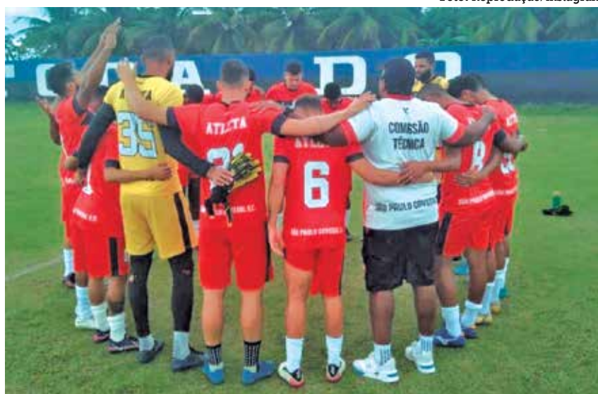
Jogadores do São Paulo vão aguardar mais dias para jogar pela Série D