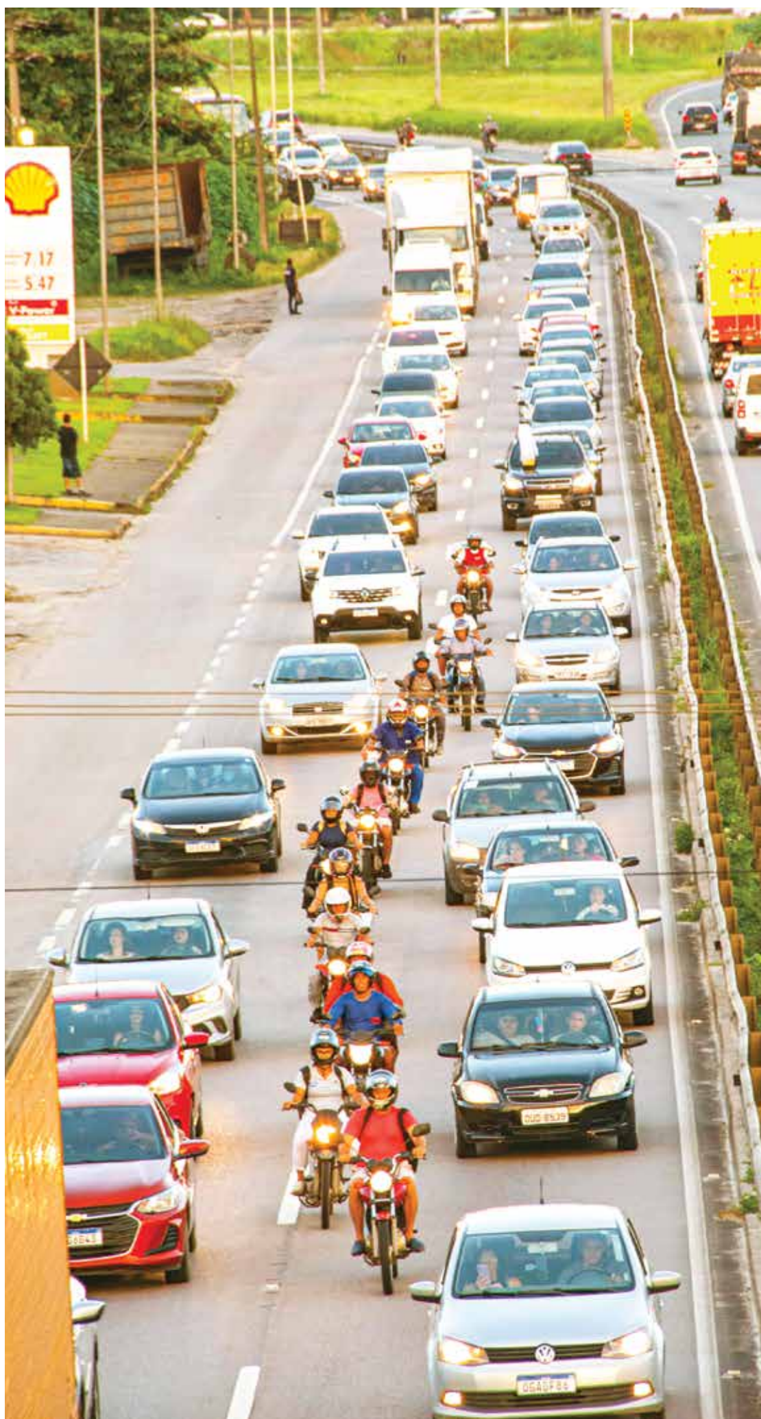
Congestionamentos em véspera de São João são comuns em rodovias, segundo informou a PRF