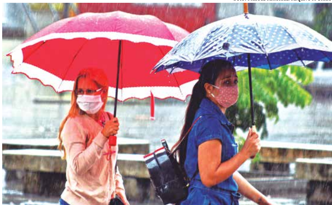
Previsão para grande parte da Paraíba é de que o dia de São João comece com pancadas de chuva