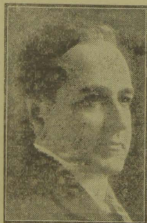
Presidente Getulio Vargas

RIO, 29 — (Pelo radio) — O "Correio da Manhã" destaca em negrita o seguinte: "Pode-