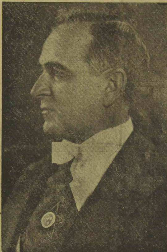
PRESIDENTE GETULIO VARGAS

O povo carioca, ante a notícia que da gravidade que por longas horas cobiçava a vida do Presidente Getúlio Vargas, vibrou numa estigmatizante