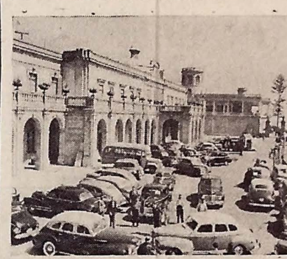
Vista geral do famoso Castelo de Chapultepec, onde foi realizada a Conferência Inter-Americana sobre os problemas de guerra e de paz.

Expectativa em torno da data e local da projetada entrevista do Grande Trio — Esperado em Moscou o emissário do presidente Truman