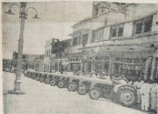
De um ataque frontal do governador José Américo à carencia de maquinaria agrícola, é o flagrante acima onde se vêem 12 tratores Ford equipados, modelo N, recentemente adquiridos à firma Monteiro Brito Cia. E o começo! Centenas ou milhares virão depois.

O meio mais fácil e comum de se colocar a disposição das árvores frutíferas os elementos nutritivos que lhes são mais necessários é sem dúvida, a adubação química. Não se pode pre-