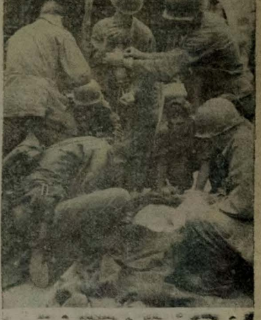
Um soldado dos Estados Unidos, seriamente ferido quando o serviço das forças das Nações Unidas na Coreia, recebe uma transfusão de sangue num campo de primeiros socorros. As tropas das Nações Unidas recebem o melhor tratamento e assistência médica e sanitária. (USIS).

Chineses e norte-americanos empenhados numa luta corpo a corpo — Resistem os vermelhos na "Serra do Dosaleito" — Prossegue lento o avanço dos aliados — Serão reiniciadas as conversações para o armistício na Coreia