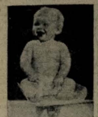
Encantador, venenoso zé. Mas seu futuro como cidadão depende dos hábitos que adquiriu na infância

Hoje, tem início, em todo o território nacional, o movimento em favor da infância e