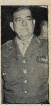
Zenóbio da Costa consergiu a visita ao Ministério da Guerra...